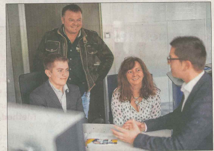
Der Ausbildungstag »Meet The Boss« bietet allgemeine und persönliche Informationen.