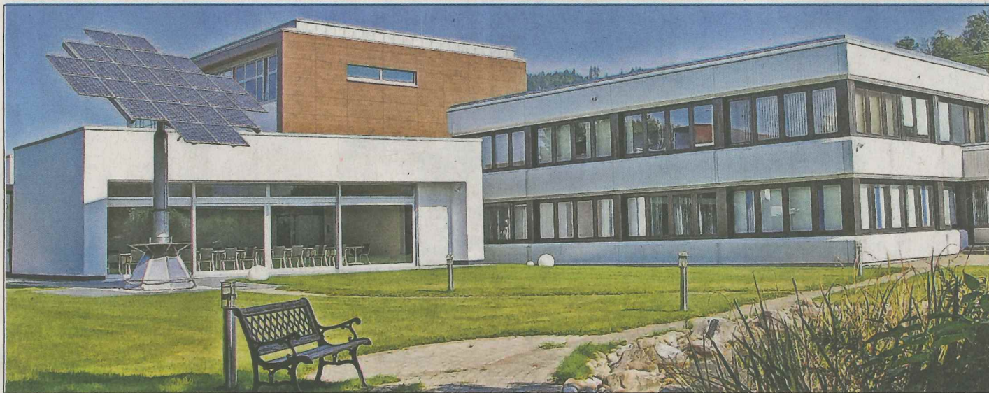
Die Gengenbacher Spitzmüller AG hat ihren Sitz in der Brambachstraße 12. Sie bietet Unternehmen Förderberatung an und ist im Spannungsfeld zwischen Technik und Betriebswirtschaft tätig.