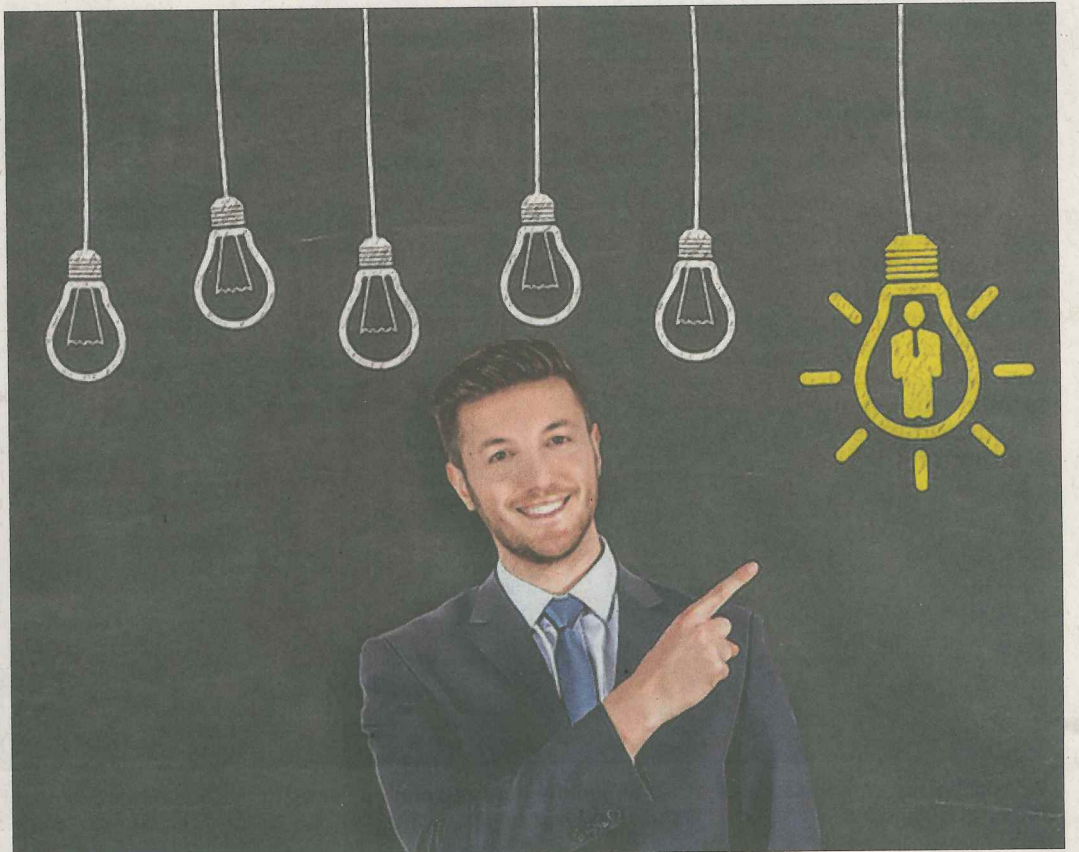
Wo geht es lang bei der Berufswahl? Der Ausbildungstag »Meet The Boss« bei der Gengenbacher Spitzmüller AG bietet zur Berufsorientierung viele Ideen.